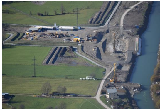
Baustelle KW Gries