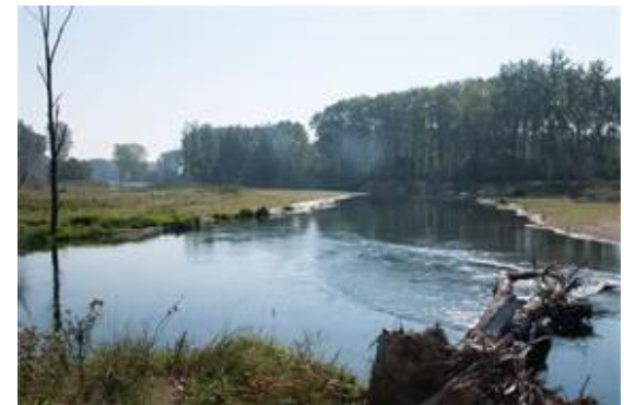
LIFE + Traisen